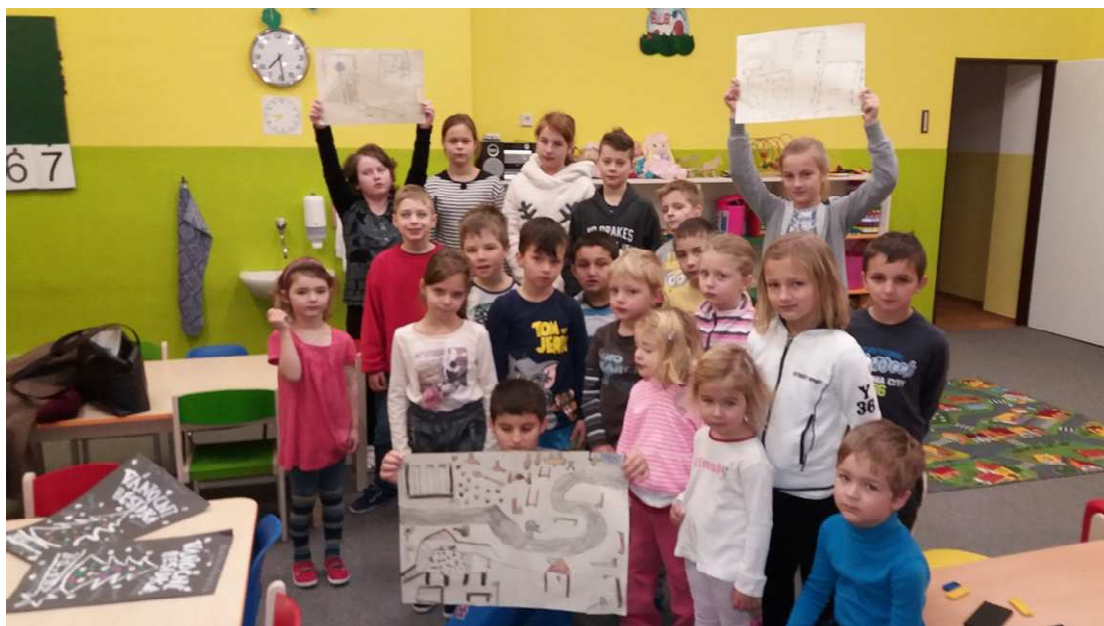
Obrázek 1 - Příprava projektu

Po vzájemném představení svých návrhů si děti odhlasovaly ty nejlepší návrhy a herní prvky, které se jim nejvíce líbily a které by si na novém hřišti přály mít. Následně byly tyto podklady předány spolupracujícímu architektovi, který všechny představy a přání ztvárnil do situačního návrhu hřiště. Z výsledného návrhu měly děti velkou radost.