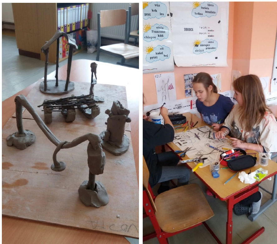
Obrázek 2 - Návrhy dětí